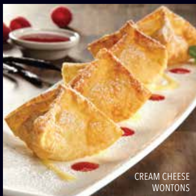
CREAM CHEESE WONTONS