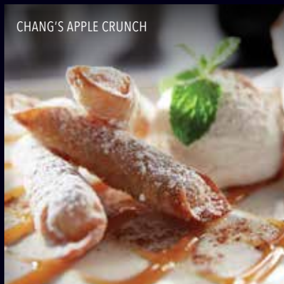
CHANG'S APPLE CRUNCH

Crujientes y cremosos wantones rellenos de una combinación de queso crema y vainilla. Rociados con azúcar en polvo, servidos con salsa de vainilla y frambuesa. Q50